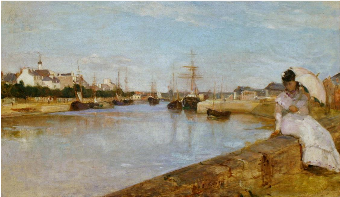
Berthe Morisot, Vue du petit port de Lorient (1869) Huile sur toile, 43,5 × 73 cm, National Gallery of Art, Washington

Seizième rencontre annuelle de l'Association canadienne d'études francophones du XIX e siècle